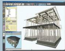
地震・台風・積雪などに耐えられるか、建物の強度を3次元で緻密に確認