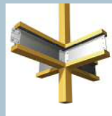
木と鉄の複合梁「テクノビーム」