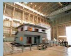
実物大の住宅で耐震性能を実証